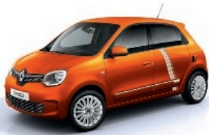
Valencia-Orange mit Striping „Full Vibes“