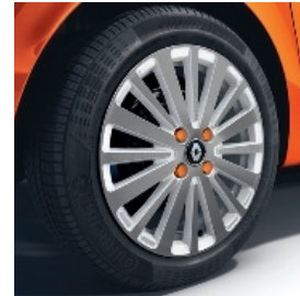
16-Zoll-Leichtmetallrad „Yeti“ mit Designelementen in Weiß und Radschraubenkappen in Orange