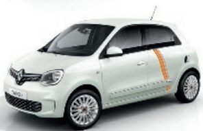
Quarz-Weiß mit Striping „Full Vibes“