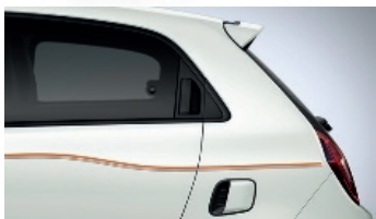
Quarz-Weiß mit Striping „3 Lines Vibes“