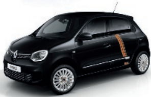
Black-Pearl-Schwarz mit Striping „Full Vibes“