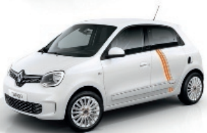
Pyrénées-Weiß mit Striping „Full Vibes“