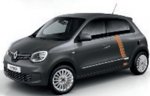
Lunaire-Grau mit Striping „Full Vibes“